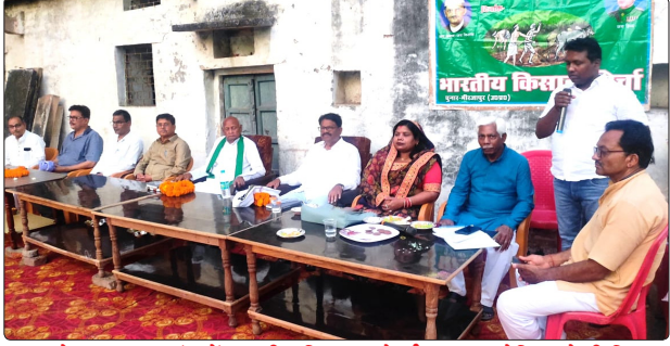
चुनार के समसपुर गांव में भारतीय किसान मोर्चा द्वारा आयोजित होली मिलन समारोह में मंचासीन मुख्य अतिथि पालिकाध्यक्ष व अन्य विशिष्ट अतिथिजन।