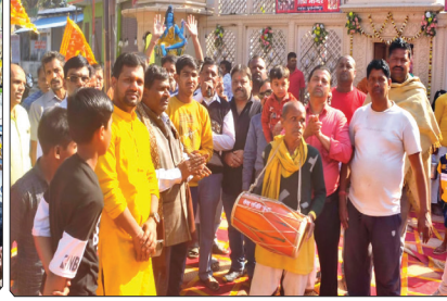
चुनार में शिवजी की निकली शोभायात्रा में भजन कीर्तन करते श्रीप्रभात भजन बोलबम सेवा समिति के सदस्य।