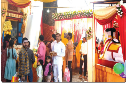
चुनार के गंगेश्वर महादेव मंदिर पर दर्शन पूजन करने पहुंचे हुए स्थानीय शिव भक्त।