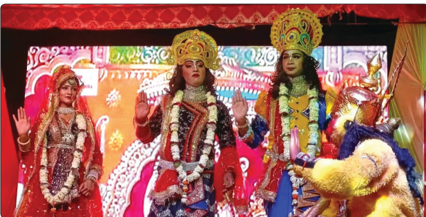
चुनार में श्रीप्रभात भजन बोलबम सेवा समिति द्वारा आयोजित शिव जागरण कार्यक्रम में झांकी की प्रस्तुति करते कलाकार।

कलाकारों ने भक्ति गीत एवं झांकी की प्रस्तुति से लोगों का मन