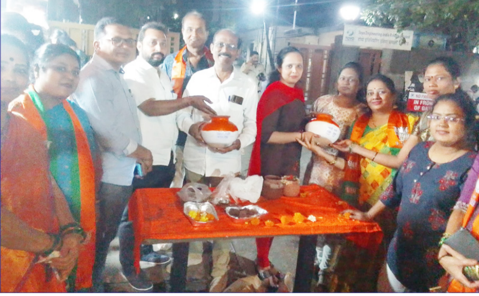
मिट्टी को नमन... वीरों का वंदन मेरी माटी मेरा देश अमृत कलश महोत्सव का समान समारोह कांजूरमार्ग मुंबई