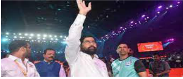
मुख्यमंत्री एकनाथ शिंदे के साथ उपमुख्यमंत्री देवेंद्र फडणवीस,

मुंबई: एक तरफ सांताक्रुज के पांच सितारा होटल में विपक्षी इंडिया गठबंधन की बैठक चल रही थी, दूसरी तरफ गुरुवार देर रात मुख्यमंत्री एकनाथ शिंदे दक्षिण मुंबई के वर्षा बंगले में महायुक्ति के मंत्रियों एवं विधायकों के साथ डिजर डिप्लोमेसी कर रहे थे। गुरुवार करीब साढ़े आठ बजे शुरू हुए डिजर में