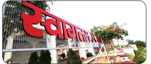
चुनार दुर्ग स्थित डाक बंगले पर ध्वज के पास स्वागतम चुनार लिखा हुआ सेल्फी प्वाइंट ।

शिवा शर्मा चुनार। स्वतंत्रता दिवस पर चुनार के ऐतिहासिक दुर्ग में विशाल तिरंगा ध्वज फहराये जाने की लगभग तैयारी पूरी हो चुकी है। दुर्ग स्थित डाक बंगले पर ध्वज फहराने के लिए 75 फीट का पोल लगाया जा चुका है। तीस फीट लंबा एवं बीस फीट चौड़ा यह ध्वज स्थानीय एवं बाहर से आने वाले राहगीरों एवं दुर्ग में आने वाले पर्यटकों के लिए आकर्षण का केंद्र होगा। दुर्ग पर फहराने वाला यह ध्वज चुनार तहसील अंतर्गत अदलपुरा एवं आसपास के गांवों से भी लोगों को दिखाई देगा। रात के समय यह ध्वज एलईडी लाइट की रोशनी से जगमगाएगा। ध्वज स्थल पर लोहे की जाली पर लाल