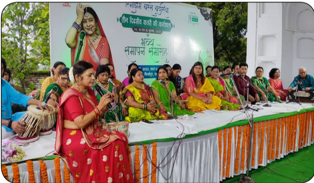
चुनार दुर्ग में एनसीएल द्वारा आयोजित कजरी कार्यक्रम में कजरी गीत प्रस्तुत करती अंतर्राष्ट्रीय गायिका मालिनी अवस्थी अपने शिष्यों के साथ।