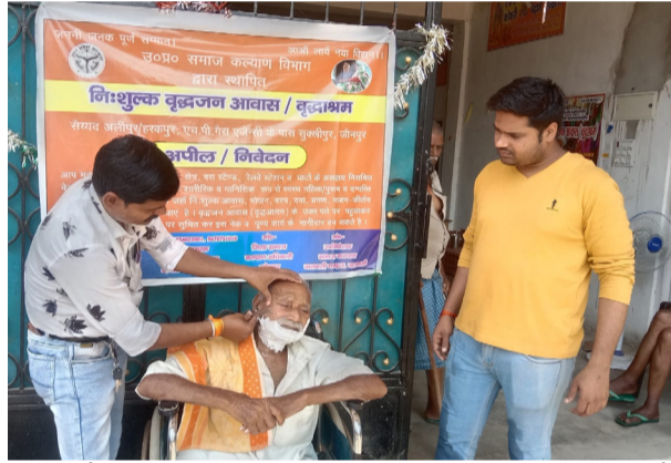
दिन पर सैयदअलीपुर स्थित वृद्धाश्रम में वर्तमान में 26 वृद्ध व 27 वृद्ध हैं।