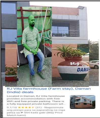
RJ Villa farmhouse (Farm stay), Daman (India) deals Located in Daman, RJ Villa farmhouse provides accommodation with free WiFi and free private parking. There is a fully equipped private bathroom with... 9.1/10 (31) - Nagasimutis ang presyo para sa pagpapating na mga petso sa ₱ 504 kada gabi (May Price Match karami)

मुंबई, भारत का पश्चिमी तट पर बहुत सारे ट्रेवल डेस्टिनेशन हैं। इसी ट्रेवल डेस्टिनेशन में से एक है दमन का क्षेत्र। दमन कई लोगों के लिए वीकेड डेस्टिनेशन है। यहां पर लोग केवल समुद्र तट ही नहीं, लोग कुछ स्वादिष्ट समुद्री भोजन और शराब के लिए भी जाते हैं। तो अगली बार जब आप उस क्षेत्र में हों, तो दमन को सप्ताहांत की छुट्टी के लिए विचार करें। और यहां ऐसी चीजें हैं जो आपको दमन में करने से बिल्कुल नहीं चूकना चाहिए।