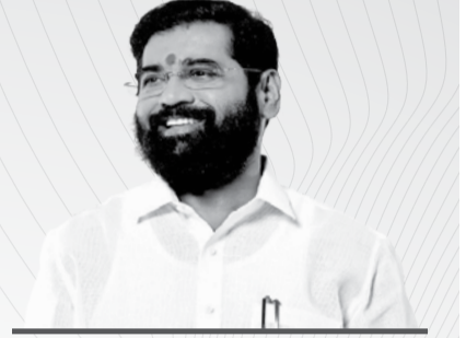
एकनाथ शिंदे मुख्यमंत्री

शिक्षणाला जोड रोजगाराची, काळजी गरजूंच्या भवितव्याची !