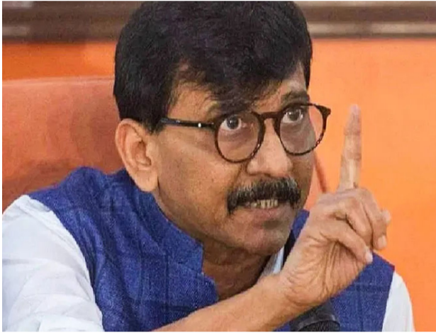
कदम कदम पर संवाददाता

नहीं देख पाएगी फरवरी का महीना- संजय राउत का दावा