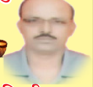
प्रसिद्धी ठाकुर बिल्डर्स/समाजसेवक

रोशनी के त्योहार 'दीपावली' पर सभी देशवासियों को हार्दिक शुभेच्छा!