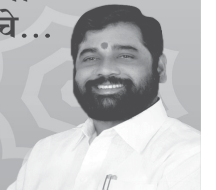
श्री. देवेंद्र फडणवीस मा. उपमुख्यमंत्री