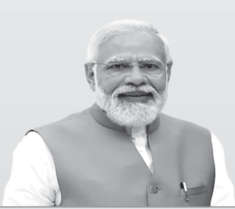
श्री. नरेंद्र मोदी मा. प्रधानमंत्री