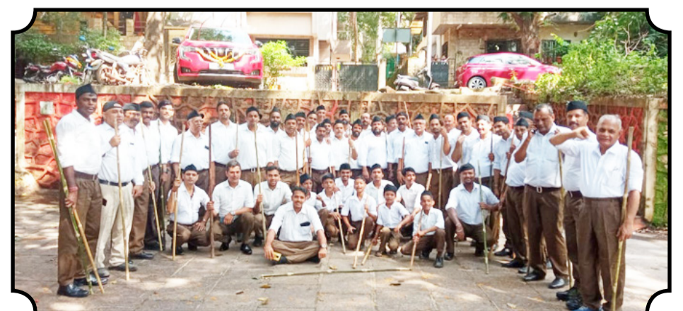
राष्ट्रीय स्वयंसेवक संघ उन्नत नगर द्वारा देव, देश, धर्म और संगठन निष्ठा पर समर्पित कार्यकर्ताओं के द्वारा पथ संचलन

भी तस्वीर देखने को मिली थी बाद तकरीबन 25 दिन के अंत एकबार फिर पूरे जिले में बा जोर पकड़ लिया। इससे इस की बारिश की तस्वीर साफ ं बीच, शुक्रवार को जिले में बारिश हुई। ठाणे शहर में छह घंटों में 47.49 मिमी दर्ज की गई है। जबकि कर डोंबिवली शहर में 94.3 बारिश रिकॉर्ड की गई है। स नवी मुंबई, भिवंडी, अंब उल्हासनगर, कल्याण शहरों बिजली के साथ भारी बारि रही है। केडीएमसी क्षेत्र और शहरों के कुछ निचले इला जलजमाव की घटनाएं सामं हैं। इस बारिश से कुछ समय दे यातायात प्रभावित हुआ है।